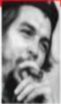
Ernesto "Che" Guevara, ARGENTINO-BOLIVIA 1928-1967